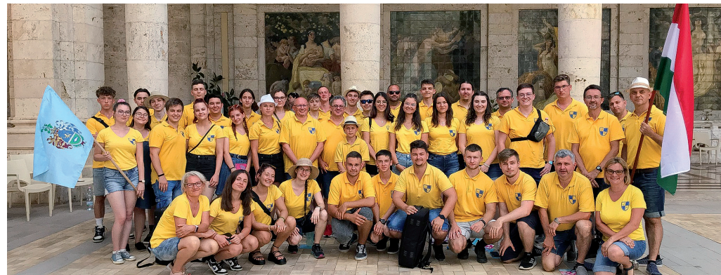
A Körösparti Vasutas Koncert Fúvószenekar az idén nyári, toszkánai turnén

– Szerencsére viszonylag sok fellépési lehetőség-