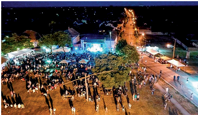
XXI. alkalommal adott otthon Kondoroson a Betyár Napoknak a Csárda melletti terület