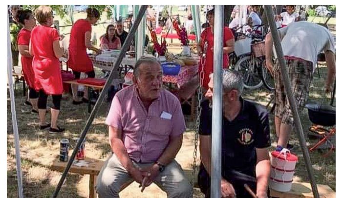
A Gerendási Hársfa Fesztivál minden évben főző versenyvel, nagyszerű hangulatban zajlik