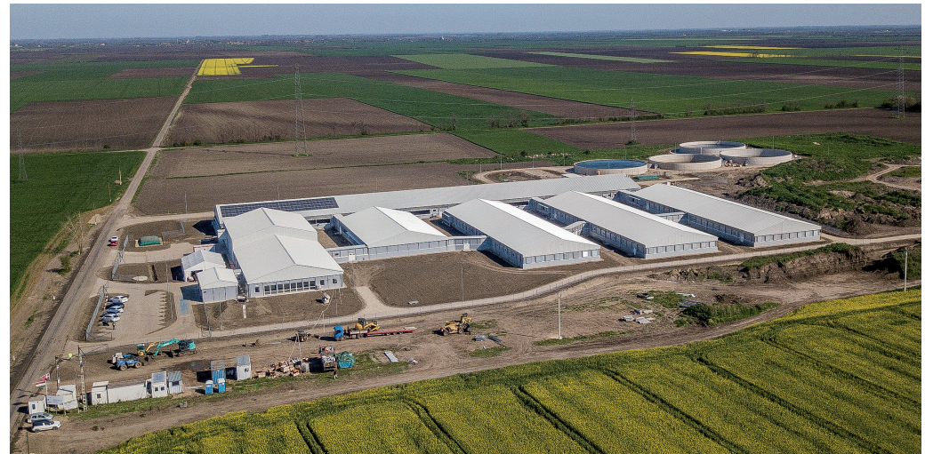
A First Farms Hungary Kft. telekgerendási kocatelepe

Az agrár területen két kiemelkedő beruházás készült el 2023-ban a választókerületben. Telekgerendáson 2400 férőhelyes kocatelep, Békéscsabán pedig évi 25 000 vágósertés tenyésztésére alkalmas sertéstelep kezdte meg a működését.