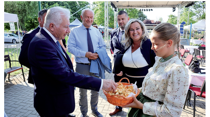
Messze földön híres a Kétegyházi Pogácsa fesztivál, amelyet idén 15-ször rendeztek meg