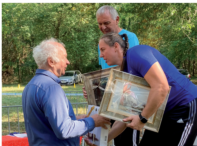
Köszönet a magyar és a békéscsabai sport képviselőiben elért sikereket!

timéterrel. Így tényleg ez a legkedvesebb verseny számomra, de a rangsorban a fedett pályás világbajnoki aranyérem következik.