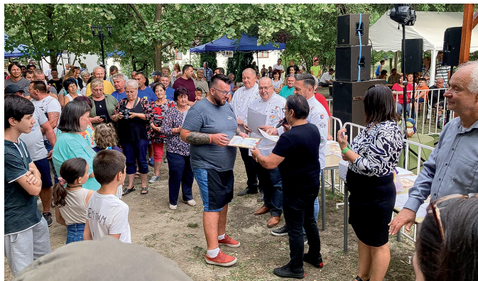
Két éve rendezték először, de már most több ezer látogatót vonz a Telekgerendási Káposzta Fesztivál