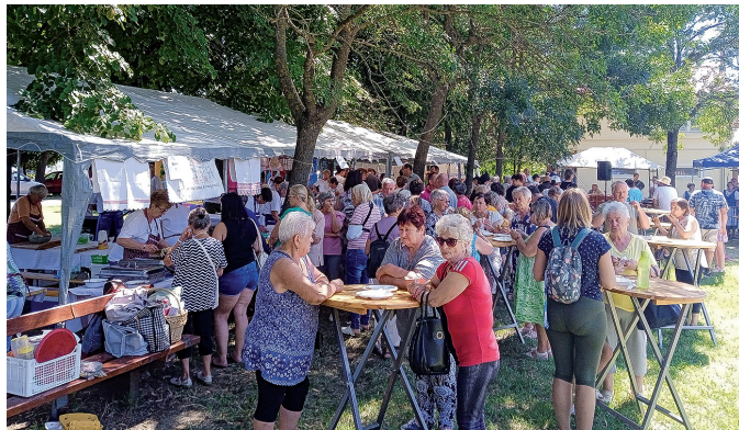
Csabasabadiba a hagyományos Alma-napra a szlovákiai szomszéd településről is érkeznek vendégek