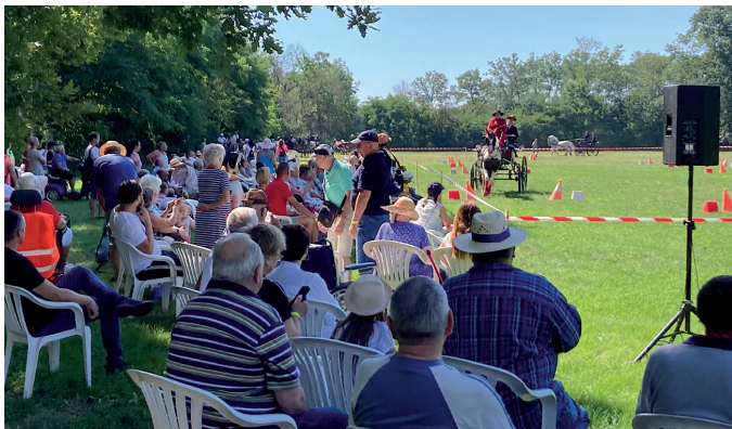
Hagyományteremtő szándékkal rendeztek Szabadkigyóson Kastély futam néven fogathajtó versenyt