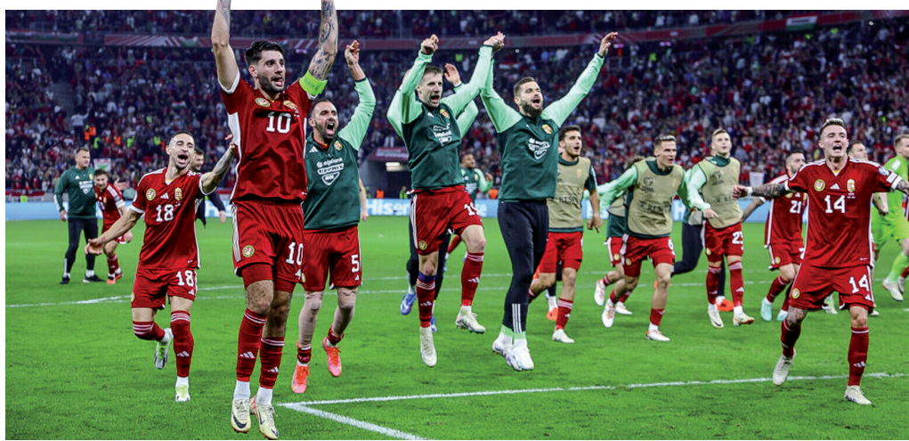
Régen ünnepelhetett ilyen sikeres évet a magyar közönség

És ha már büszkék vagyunk a magyar válogatottra, legyünk büszkék békéscsabai iként arra is, hogy a nemzeti