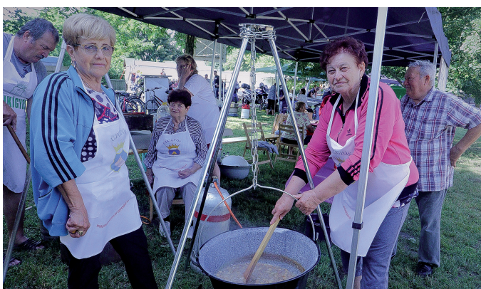
Az Újkígyósi Galiba Napok a településen sokaknak megélhetést adó libatartásnak állít emléket a főzőversennyel