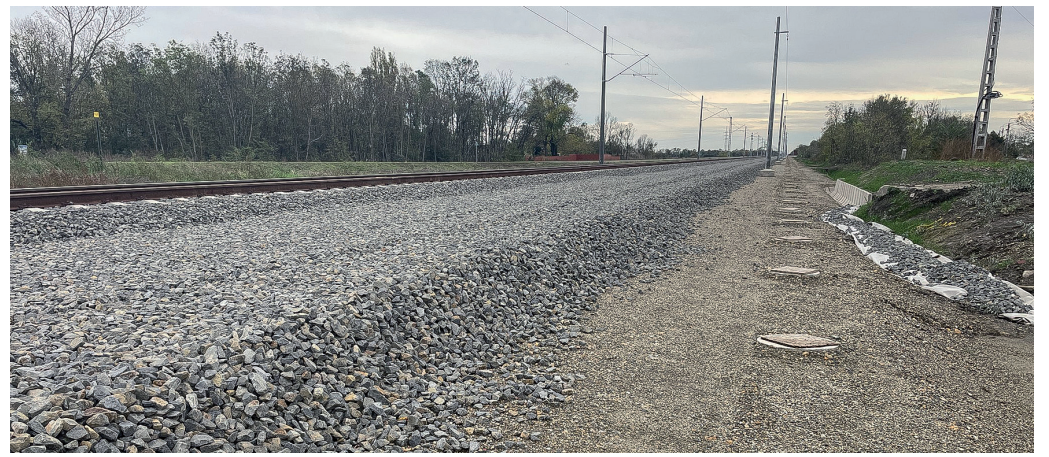
A Kenderföldeknél a zajvédő falak kehelyalapjai elkészültek, a falak telepítése 2024 első felében történik meg

A választókerületben folyó beruházások közül a legnagyobb volumenű a Békéscsaba-Lökösháza közötti vasútvonal rekonstrukciója, amely közel 150 milliárd forintból valósul meg. A munkák nem csak látványosan zajlanak, de már érzékelhetők is a lakosság számára az eredmények, hiszen december 7-én megnyitották a forgalom számára a kétegyházi vasúti felüljárót, valamint az állomásépülethez kapcsolódó, a vágányok megközelítésére szolgáló aluljáró is átadásra került. A tervek szerint egy év múlva teljesen befejeződik az építkezés, így lényegesen rövidebb idő alatt érhető majd el vonattal Dél-Erdély, Bukarest, illetve a Fekete-tenger.