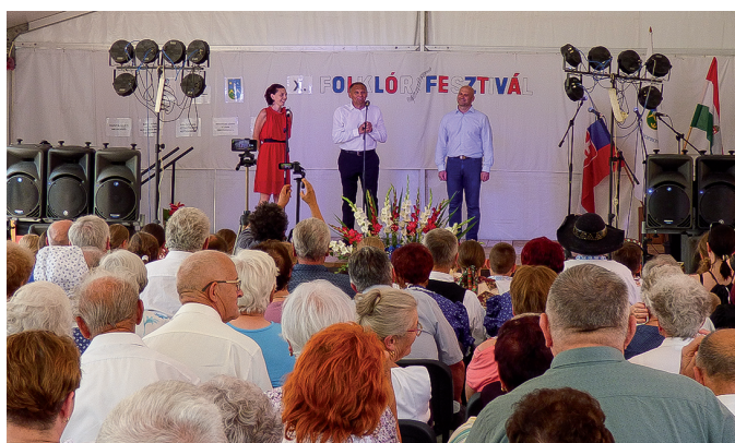
A Szent István napi ünnepség és Folklor Fesztivál hagyományosan Kétsoprony legnagyobb kulturális rendezvénye