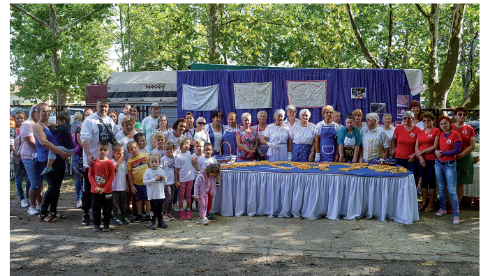
22-szer gyűlt össze a város és a környező települések apraja-nagyja a csorvási Gazda Napon és Fogathajtó Versenyen