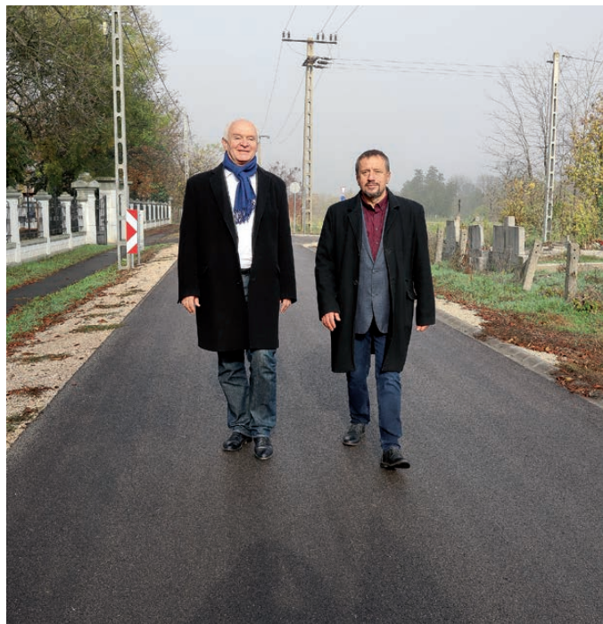
A Németh Lajos utca is szilárd burkolatot kapott

A munkák során 35 706 négyzetméternyi utcafelület, és 65 649 négyzetméter területű járda újult meg. Az új utak építése során 20 136 méter hosszan készítettek a kivitelezők aszfalt burkolatot.