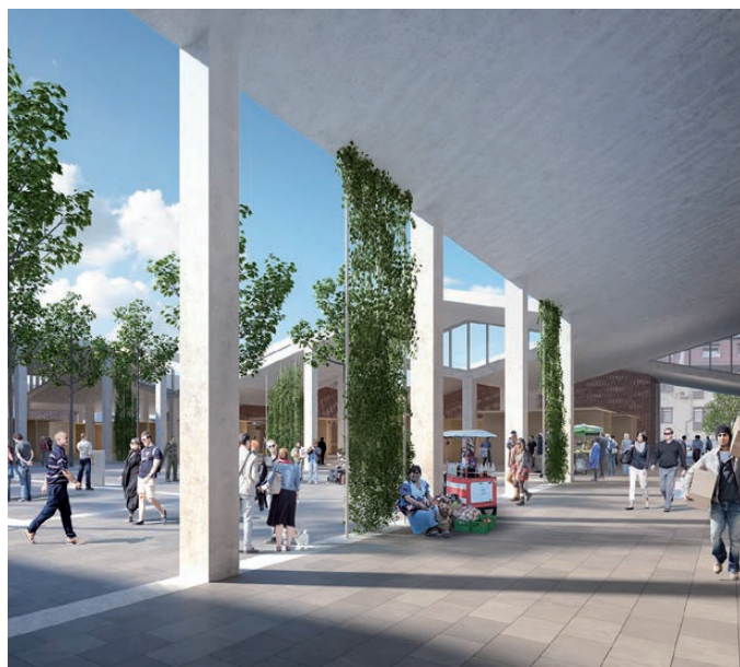
Az új vásárcsarnok belső terének látványterve

Látványosan halad az új vásárcsarnok építése. A lendő új vásártérben 18-30 darab üzlethelyiség kap helyet, amelyek közül a szélső üzletek esetében külső terület felé történő árusításra is lesz lehetőség. A térszervezés lehetővé teszi a vásárlók több irányú cirku-