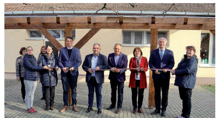
Megújult az óvoda a Magyar Falu Programban

– Nagyon sokszor említettem, hogy a Magyar Falu Program a település életében egy sikertörténet. Kevés pénzből lehetett nagy dolgokat megvalósítani. Természetesen mindenképpen meg kell köszönnünk a munkáját Herczeg Tamás országgyűlési képviselőnek, a Nemzeti Összetartozás Bizottsága alelnökének, aki teljes mértékben támogatta az elképzeléseinket. Járdát építettünk, utat építettünk, óvodát, játszótérrel újítottunk fel. Ha ezeket nem sikerült volna megtenni, akkor tovább