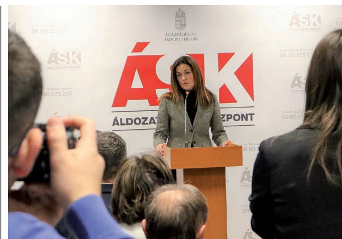
Dr. Varga Judit igazságügyi miniszter asszony adta át az Áldozatsegítő Pontot Békéscsabán

– A világ a háborúk, a migráció és a járványok korát éli, de ezzel együtt is nagyobb biztonságot, nyugalmat, békességet remélek hazánkban. Azt szeretném, ha bármi is történik, az emberi kapcsolatok, baráti és családi közösségek adjanak erőt, optimizmust a mindennapok nehézségeinek megéléséhez.