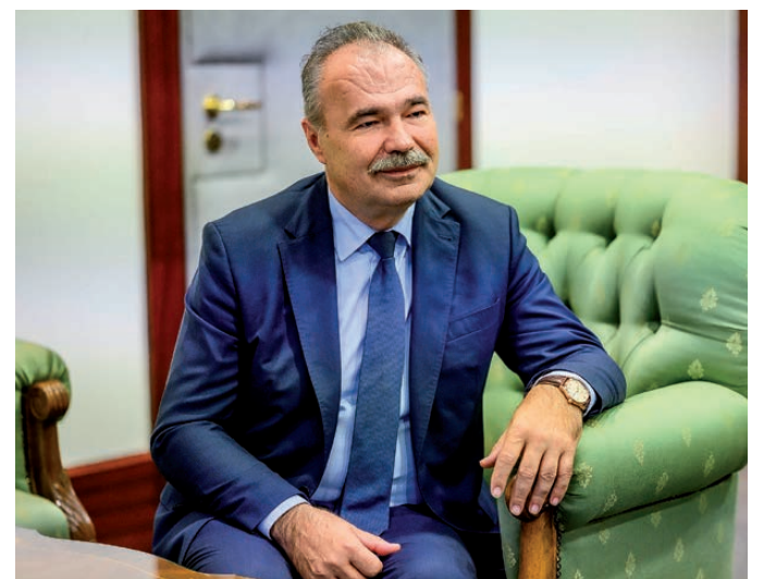
Nagy István agrárminiszter

Történelmi léptékű nehézségek és történelmi lehetőségek mellett történelmi a felelősségünk is. Mindnyájunknak, akik az agráriumban, az agráriumért dolgozunk. Az eredmények és a siker pedig az egész országé.