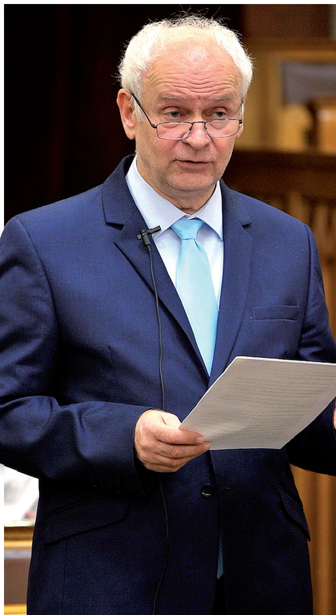
Herczeg Tamás az Országgyűlésben megválasztása óta tizenháromszor szólalt fel, két önálló indítványt terjesztett be

– Most hirtelen három dolog jut az eszembe. Eddig is sok meghívást kaptam különböző eseményekre, de a választás óta lényegesen megnőtt ezeknek a száma. Másrészt a tíz településnek mennyiségre is sok – és sokféle, különböző – olyan története van, amiben a képviseletüket kérik, és elvárják az országgyűlési képviselőjüktől. És ez teljesen rendjén van így! Nagyon sokféle olyan feladata van az egyéni képviselőnek, ami a települési önkormányzatok, illetve a településen élők különböző élethelyzetéhez igazodó elvárás. Ezek egy része teljesíthető, más részük kívül esik a képviselői megoldási lehetőségek tárházán. A másik területe a munkámnak a törvényalkotás kérdésköre,