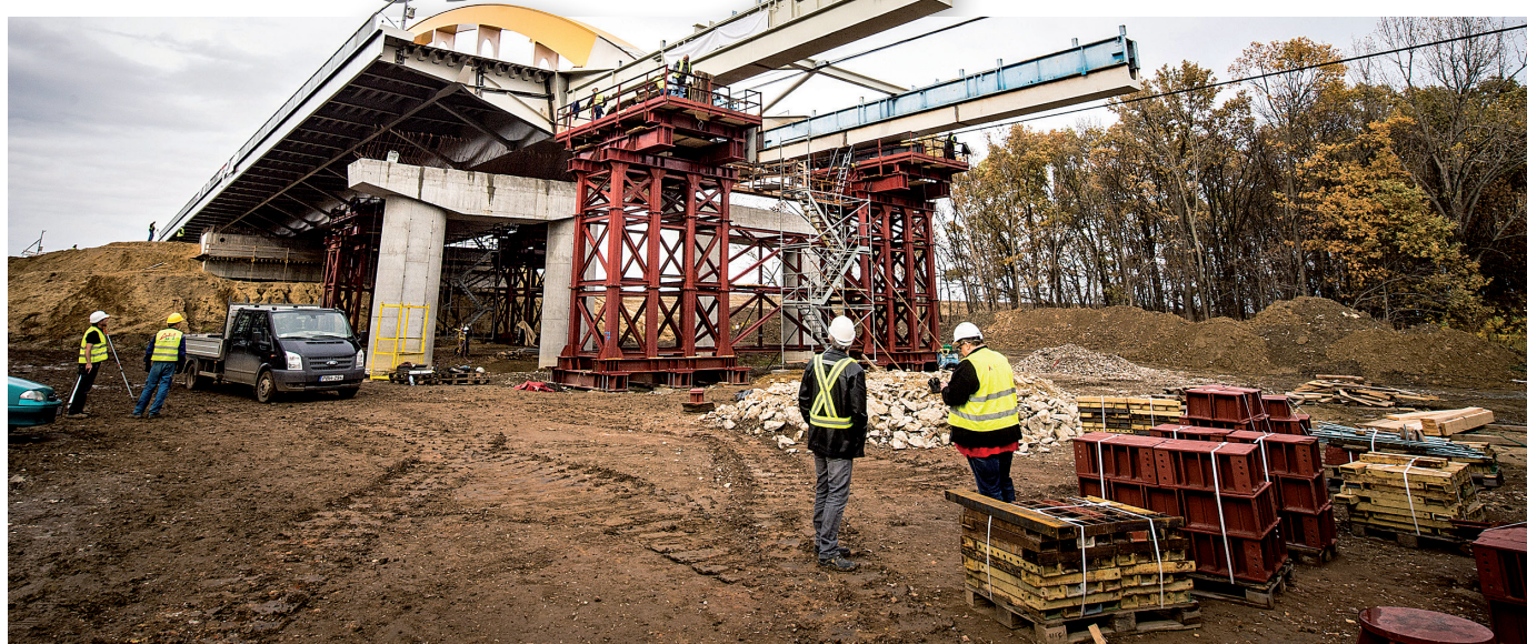
Helyére került november elején az M44 gyorsforgalmi út Körös-hídjának központi eleme

Fagyos februári délelőtt volt, amikor a kivitelező átvette ez év elején az M44-s gyorsforgalmi út Békéscsaba-Kondoros közötti szakaszának munkaterületét. Alig tíz hónap alatt látványosan elindult a munka, miközben a Tiszakürt-Kondoros nyomvonal bizonyos részeit már az utolsó simításokat végzik.