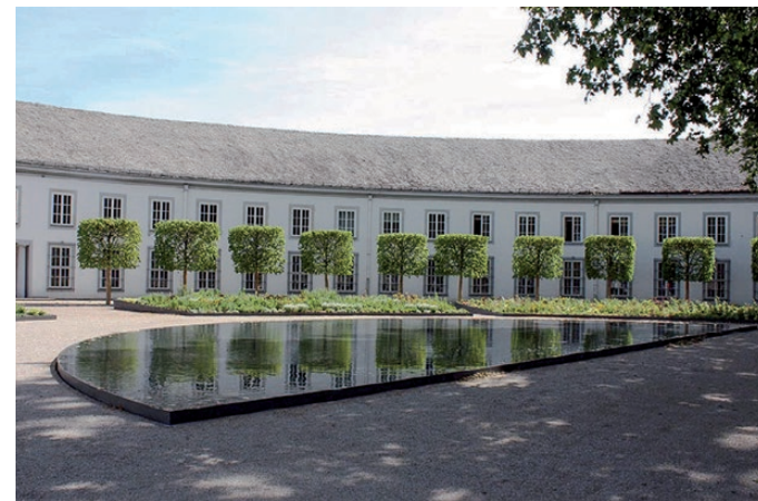
A kastély belső udvarát medence díszíti majd

Gerla legszebb épülete lehet az Ybl Miklós tervei alapján 1860-ra elkészült, 37 szobás Wenckheim-kastély. Az épületben a II. világháborút követően szakmunkásképző iskola működött, majd annak itteni megszűnését követően az épület állapota rohamos romlásnak indult. Többszöri árverés után került a jelenlegi tulajdonoshoz, aki ígéretet tett az ingatlan teljes felújítására. A tervezési folyamat lassan a végéhez közelít, és belátható időn belül régi pompájában ragyoghat az épület. A felújítás előtt készült látványtervek alapján, a fejlesztés befejeztével a település igazi büszkesége lesz a kastély.