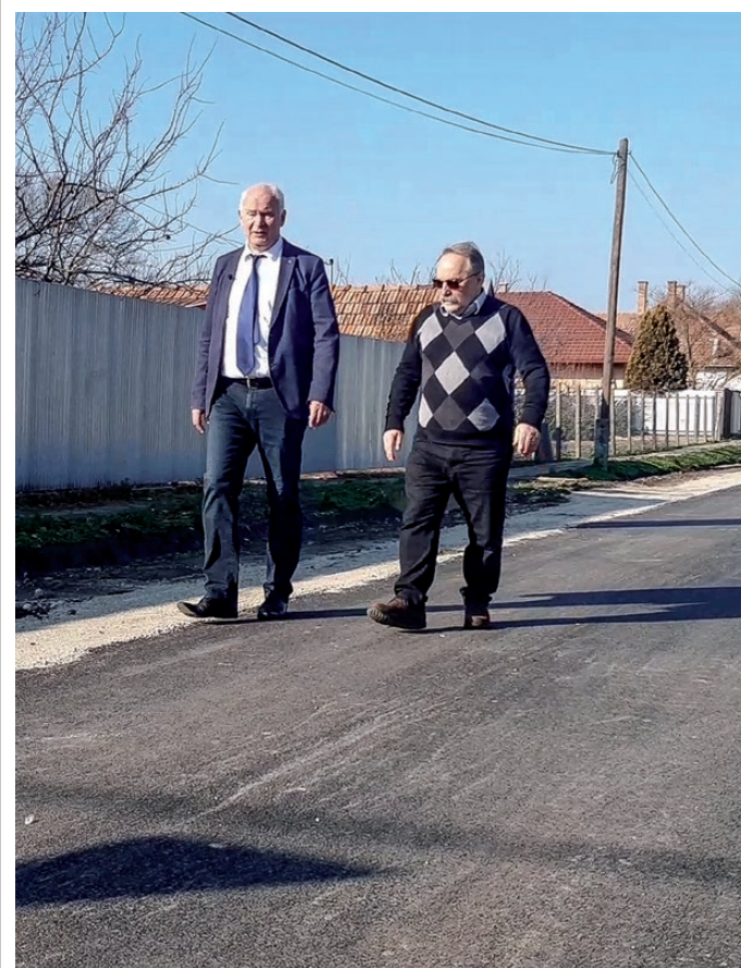
Az új szilárd burkolatú utak egy része már tavaly ősszel elkészült

Az egész világon végigsöpörő járvány nem csak az egészségünkre, de mentális állapotunkra és a gazdaságra is súlyos, negatív hatással volt. A magyar gazdaság ugyanakkor rekord gyorsasággal állt talpra, és tavaly minden eddigi nagyobb teljesítménynövekedéssel, 7,1 százalékos GDP emelkedést ért el.