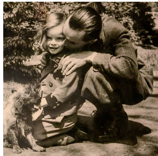
A grófnő gyermekkorában édesapjával

Igazán szeretem Ókígyóst, és nagyon büszke vagyok rá. Szépen megcsinálták, szépen helyrehozták. Horthy Miklós is járt Ókígyószra, de többször hozzánk is eljött.