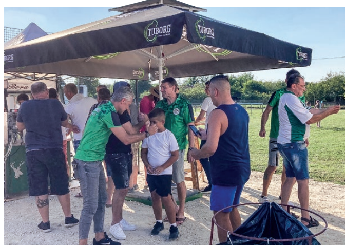
Igazi családi és baráti programot jelentenek a Mezőmegyer SE hazai futball meccsei

– Mennyi hazai játékos található a csapatokban?