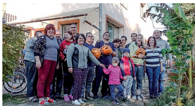
A nagy család igazi otthonra lett Mezőmegyeren

– Vannak békéscsabaiak, de jött lakónk Békéscsaba és Szegedről is. Nevelőszü-