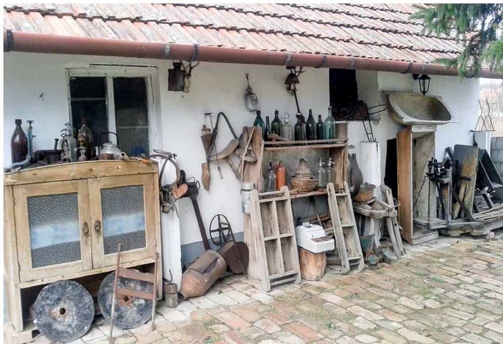
A geocachingnek köszönhetően bárki rálehet a helytörténet itt bemutatott kincseire