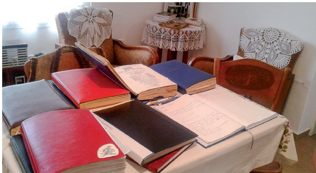
A múlt emlékeit régi könyvek, feljegyzések is megelevenítik a látogatók előtt

Végül felelevenítettük az 1975 óta működő, de 2009-ben, mint Telekgerendási Borouka Pávákör néven bejegyzett szervezet történetét, akik hitvallásuk szerint szeretnék példát mutatni a fiatalabb nemzedéknek, megtanítani a gyermekeket a hagyományos értékek szeretetére. Elsődlegesen helyi magyar és szlovák népdalokat gyűjtöttek és dolgoznak fel, rendezvényeket, találkozót szerveznek, fellépésekre, versenyekre járnak, ahol országsszerte kimagaslóan szerepelnek.