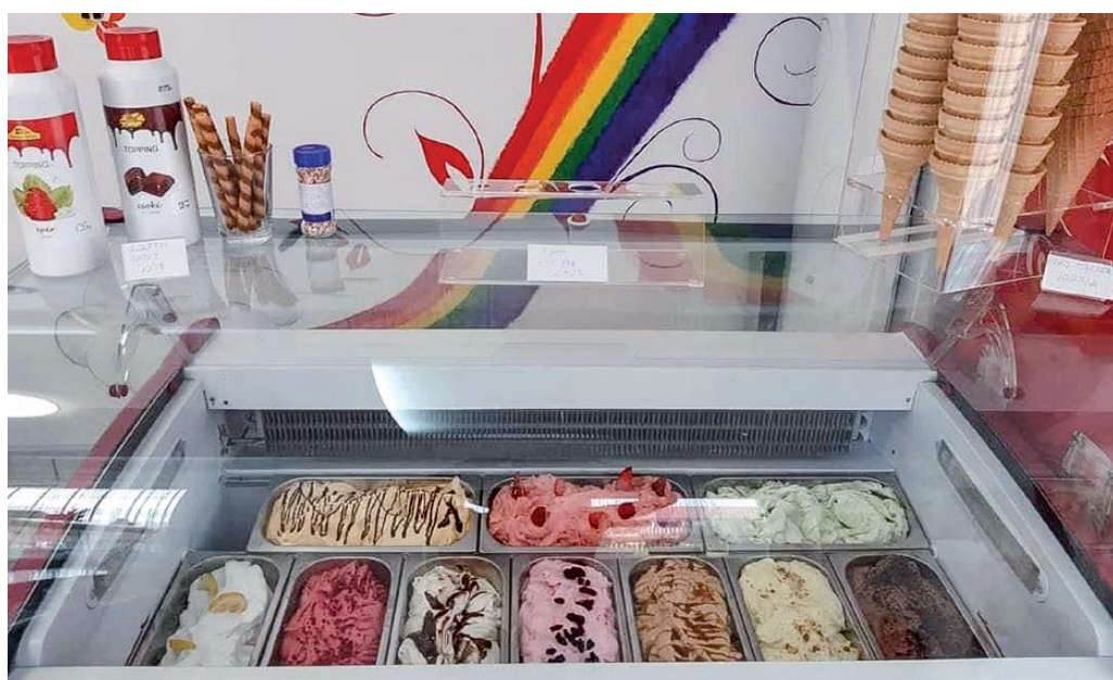
A hagyományos, igazi gyümölcsből főzött tejes fagyalagok mellett lesz cukormentes is