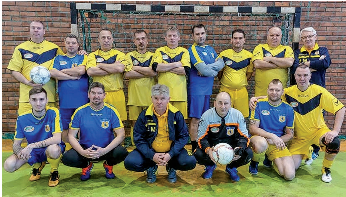
A Telekgerendási Öregfiúk csapata a sport révén épít jó kapcsolatokat

kos is játszott, míg a másik csapatunk az ötödik helyen végzett. Helyben is igyekeztünk népszerűsíteni a tömegsportot. Tavaly az év utolsó napján, nagy létszámú vállalkozó szellemű sportolni és kikapcsolódni vágyó gyermek és felnőtt jelent meg az önkormányzati hivatal előtt, hogy egy vidám hangulatú délelőtti együtt búcsúztatva az