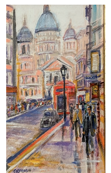
Csernus Tibor festménye

Hozzátette, hogy ez a legenda szó sokfelé meghonosodott, Erdélyben egy Legendárium nevű civil szervezet is működik. Kondoroson azzal a céllal jött létre az alapítványuk 2008-ban, hogy a települési hagyományok megőrzésén, valamint az öko-turizmus fejlesztésén keresztül hozzájáruljanak a helyi értékek védelméhez, a helyi társadalom megújításához, továbbá a környezeti nevelés eszközeivel bemutassák egy fenntarthatóbb életmód lehetőségeit a helyi lakosoknak, a térségben tanuló diákoknak