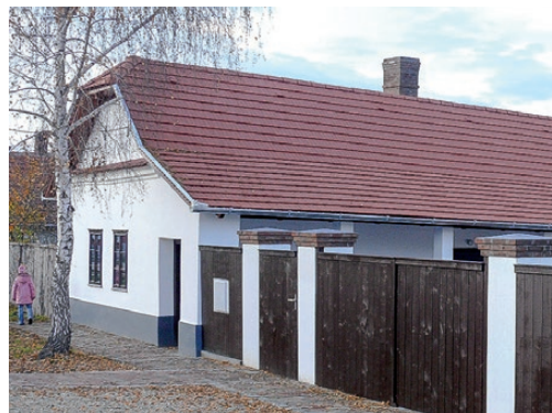
Táj- és Alkotóház

dásztársaság, amit egy év múlva be is jegyeztek - osztotta meg beszélgetőtársam, aki a település híres szülöttjeit is elsorolta.