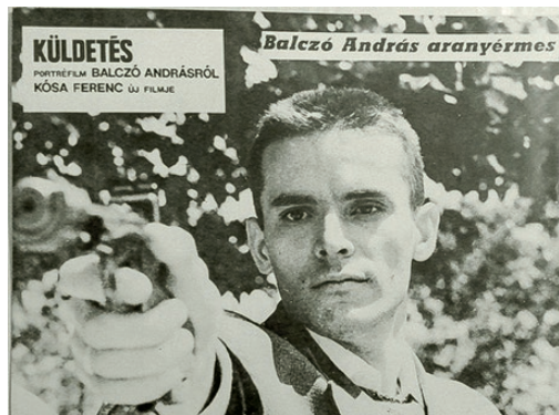
Balczó András olimpiai bajnok