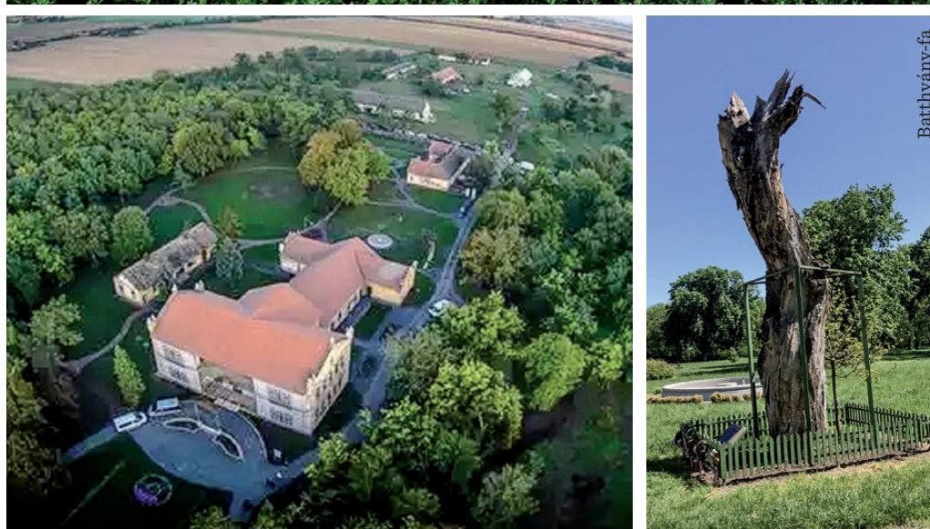
Felújításra vár a kastély és a hozzá tartozó épületek

kastélyától, ám a homlokzataik színe megegyezik.