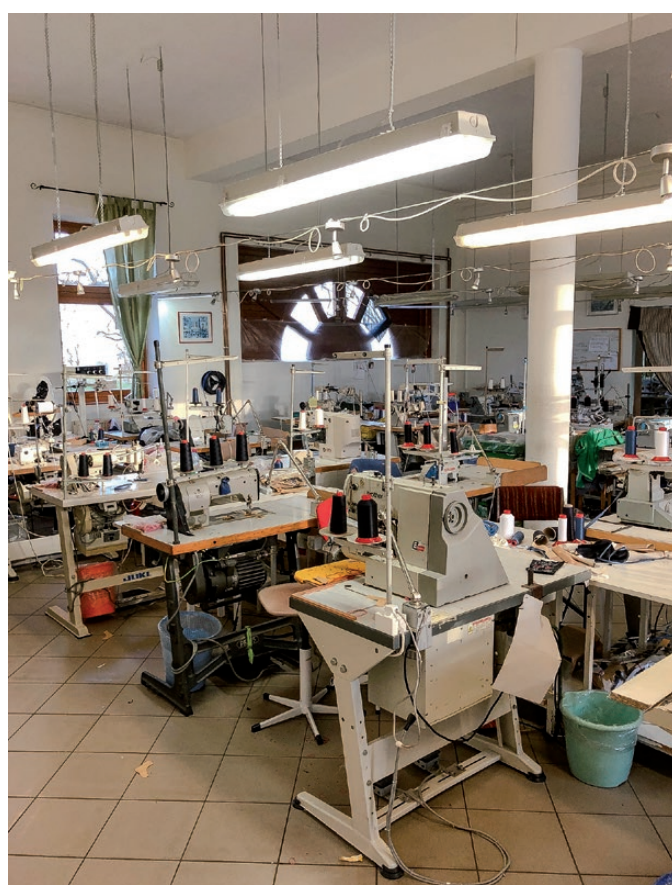
Ügyes kezekre várnak a varrógépek

Mivel mi vagyunk a község egyik jelentős foglalkoztatója, ezért is fontos célkitűzés volt a munkahelyek megőrzése a mögöttünk hagyott nehéz esztendőben. A kormányzat segítségével, az OFA „Azonnal cselekszünk munkahelymegőrző program” támogatásával sikerült mindvégig