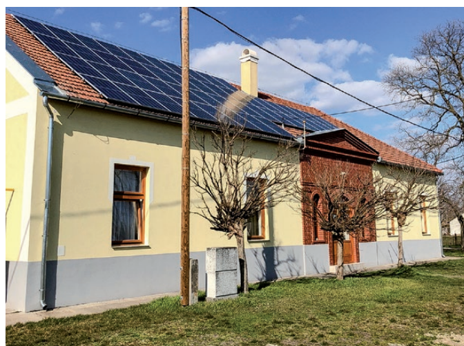
A telephely a majorság területén

megtartani a teljes dolgozói létszámot. Enélkül a támogatás nélkül talán ma már nem is működne a varroda.