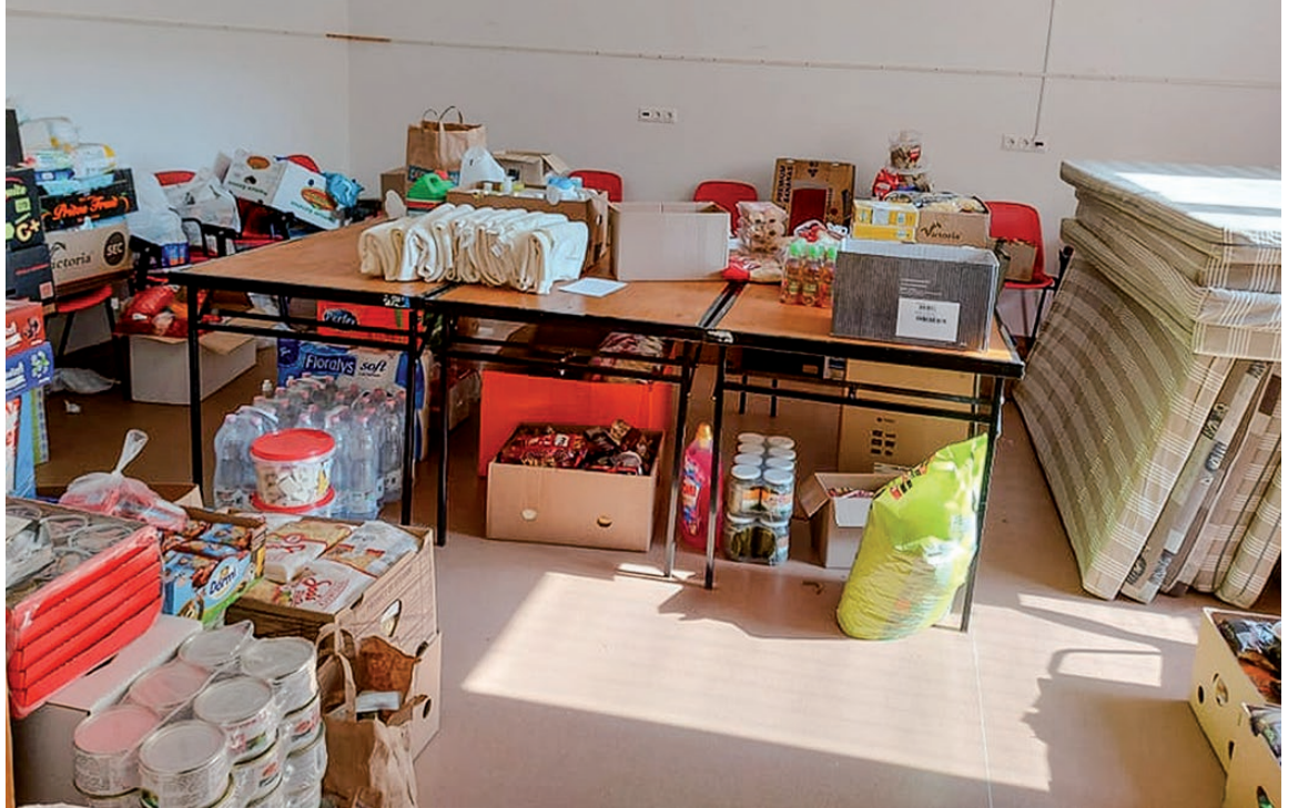
Két nap alatt hatalmas mennyiségű adomány gyűlt össze

Elkészült az ország legsebbe kastélya főépületének a rekonstrukciója, ugyanakkor még előttünk áll a B épület felújítása. Szeretnénk, ha ez a munka mihamarabb elkezdődhetne. A kastély további fejlesztési elképzelései között szerepel a szállodafunkciónak a fejlesztése, amihez termálvizet szolgáltatás társulna. A településen szeretnénk egy idősgondozással foglalkozó intézményt is létrehozni, hiszen nem csak a fejlődés, a fiatalok helyben tartása, de az idősek gondozása és megbecsülése is fontos számunkra.