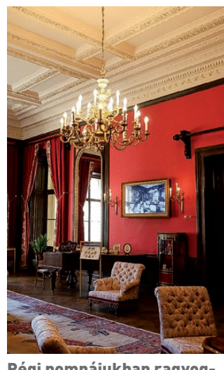
Régi pompájukban ragyognak a belső terek