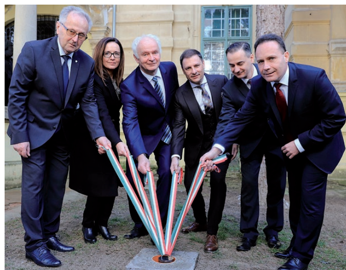
Három évvel ezelőtt helyezték el a fejlesztés alapkövét