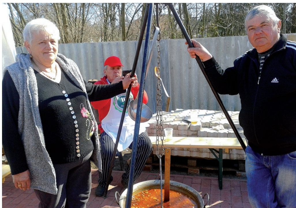
A főzés olyan közösségi elfoglaltság, ami összehozza az embereket