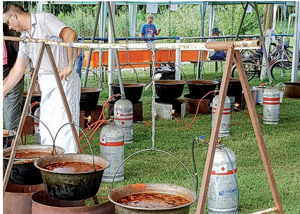
A Hársfafesztivál a hagyományoknak megfelelően idén is főzőversenyyel várja az érdeklődőket

hivatalos versenynaptárban kiírt futamokat takar. Sok érdeklődőre tartanak számot a helyiek. Novemberre a szlovákok tervezik az Erzsébet-Katalin bált, majd a téli ünnepkör beköszöntével az adventi foglalatosságok adnak lehetőséget a falu apróinak nagyjának a közös tevé-