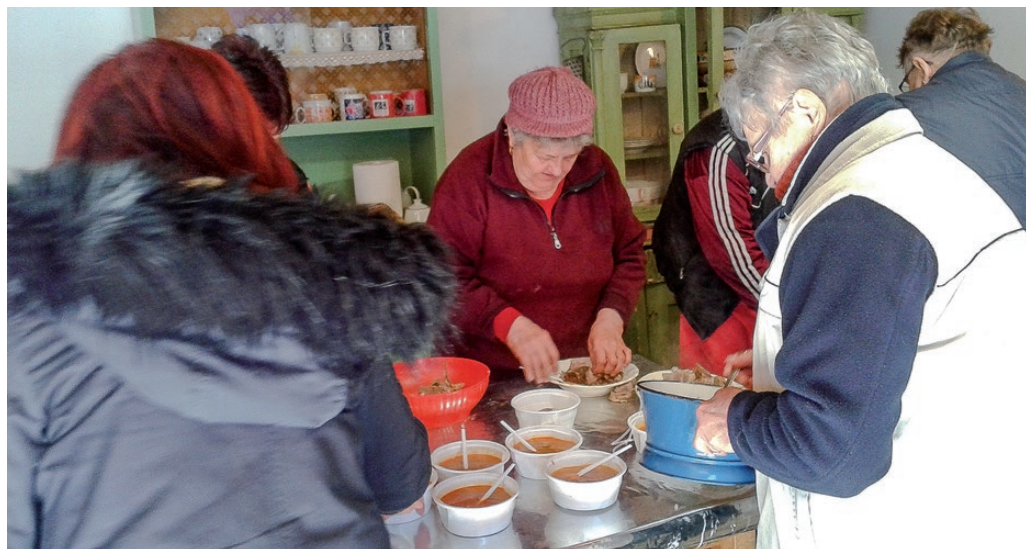
Szorgos kezek porciózták az ebédet a disznótör résztvevőinek

– Az itteni egyesület régen klub volt, jelenleg 87 fős a tagság, ma olyan hetvenen fordultak meg itt. Az egész hetünk nagy izgalommal telt, mert az emlékházban még el kellett végeznünk az utolsó simításokat a vendégek fogadása előtt. A házra még 2015-ben egy leaderes pályázaton sikerült nyernünk ötmillió forintot, és azóta is mindig van teniszpályával. Belekerült az