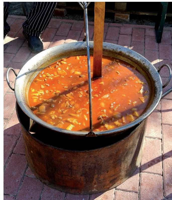
Bográcsban főtt a töltött kaposzta és a körömpörkölt is

a gyűjtemény is, aminek a darabjait mintegy tizenegy évig szedtem össze, őriztettem, rakosgattam egy fóliásátorban, arra gondolva, hogy ezt meg kell mentenünk az utókoroknak. Úgy érzem, jó úton haladunk - nyugtázza az elnökszónya, aki még több helyi rendezvényt látna szívesen a községben. Ők is a pandémia utáni nyitás reményében szólították meg az embereket, bízva abban, hogy a közösségi élet is felindulásnak indul.