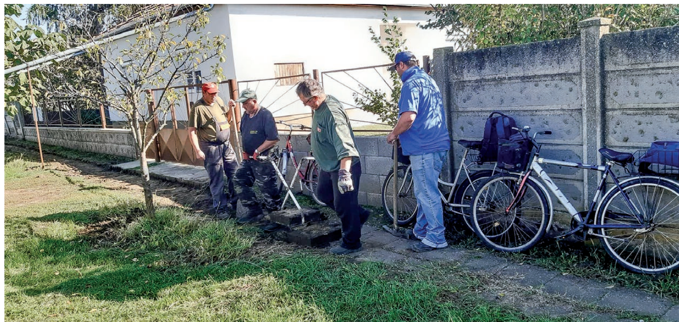
Járdaszakaszok megújítására is lehetőség nyílt ebben az esztendőben

• Illegálisan lerakott hulladék felszámolása, napelemes kamerarendszer kialakítása, 6 helyszínen történt meg a telepítés – 14 490 800 Ft.